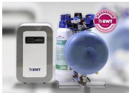
bestaqua coffee mg BL5Q0914

BWT bestmax PREMIUM und BWT bestmax COFFEE sorgen für optimales Kaffeewasser